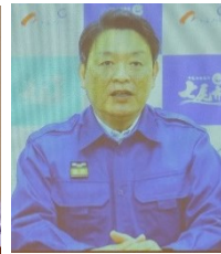
北陸ブロック構成員 七尾市長 茶谷 義隆 （ビデオメッセージ）