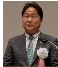
代表幹事 稲城市長 高橋 勝浩