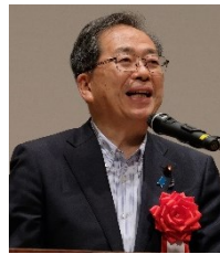
国土交通大臣 斉藤 鉄夫