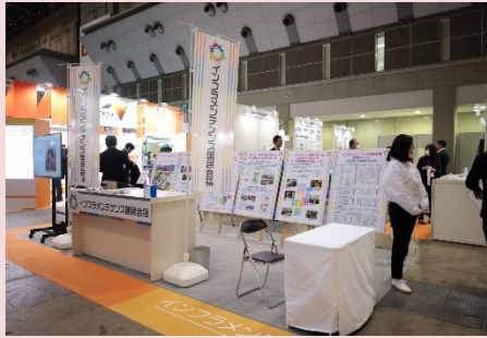
国民会議ブース全景