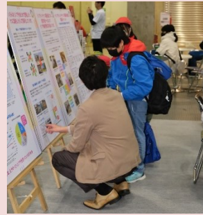
国民会議ブースを訪れた小学生