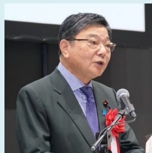
古川 康 国土交通副大臣