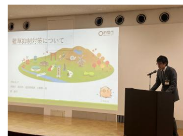
③関主任からの取組紹介