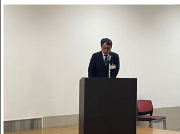
①吉澤建設部部長挨拶